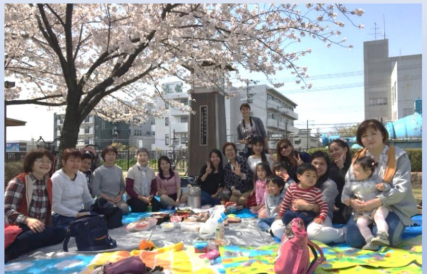
日本語サロンのお花見